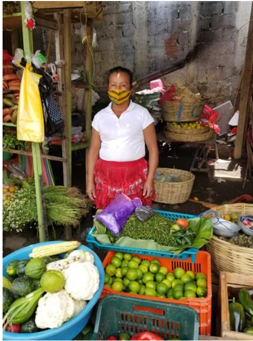
Imagen 5. Historia de vida, vendedora del Municipio de San Pedro Sac., San Marcos.

Fuente: fotografía de Marcia Fuentes 25/05/2020.