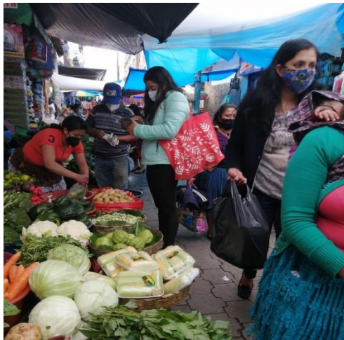
Imagen 1. Día de plaza en el Municipio de San Pedro Sacatepequez, San Marcos.

Reconsiderando su ubicación geográfica en el departamento y la dinámica social existente, evidencian el por qué en los últimos años, la economía informal ha permitido que sea centro de albergue de muchos migrantes a nivel de la región occidental, dada las oportunidades diversas de autoempleo derivadas del comercio, la prestación de servicios (alimentación, transporte, domésticos, etc.), la agricultura, entre otros; las cuales para el entender de muchos es un sector económico informal dentro uno mayor denominado formal por las obligaciones y relaciones entre ambos.