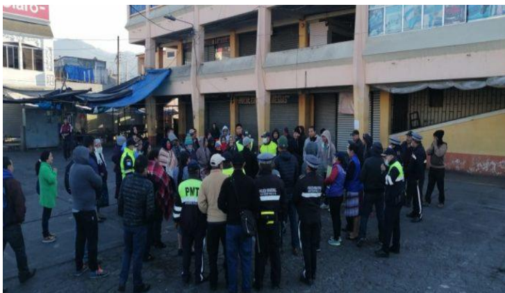
Imagen 2. Vendedores inconformes agredieron a personal de la Municipalidad de San Pedro Sacatepequez, S.M.

En este contexto, para el gobierno municipal sampedrano, dictar e implementar regulación de horarios y el traslado de los comerciantes a espacios abiertos y amplios, principalmente para evitar la aglomeración de personas en los mercados y plazas municipales tradicionales, ha propiciado enfrentamientos verbales e incluso físicos entre los vendedores y empleados municipales; creando cierta inestabilidad social derivado de las actitudes negativas y violentas de parte de la población.