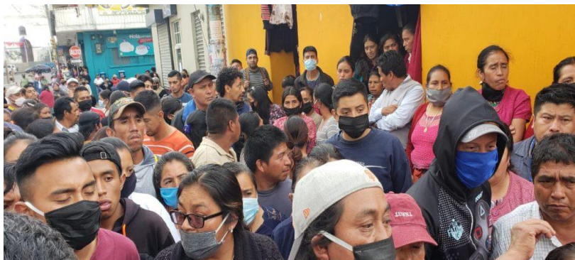
Imagen 3. Protesta de vendedores frente a la Municipalidad de San Pedro Sacatepequez, San Marcos, por traslado de plaza al costado del estadio municipal.