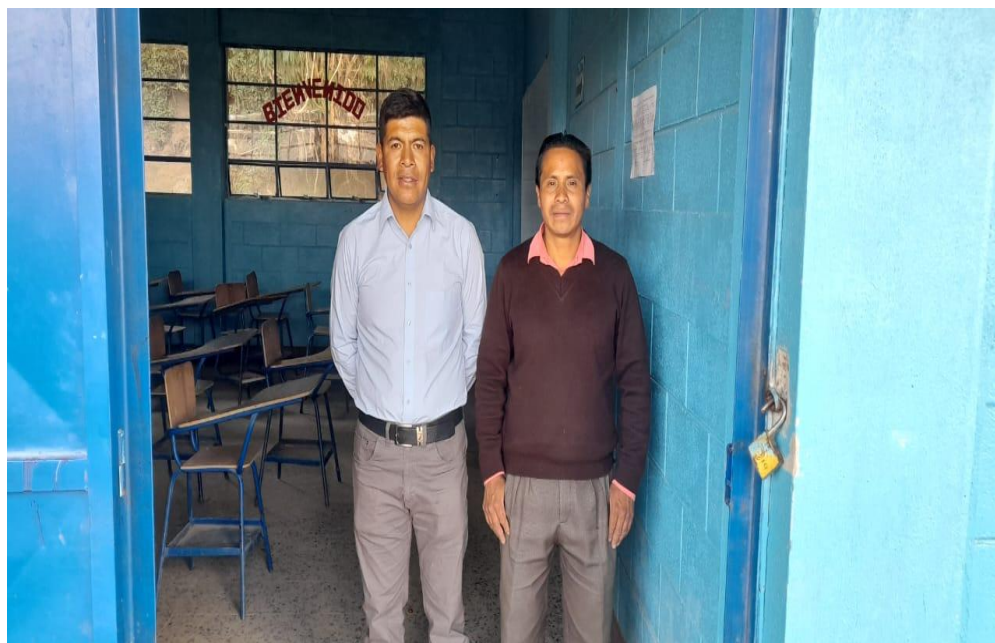
Ilustración 9 Investigación de campo con director del Instituto Básico de Aldea Piedra de Fuego.

FUENTE: investigación de campo, Institutos de Educación Básica por Cooperativa de Las Aldeas Piedra de Fuego y Tuichilupe, Comitancillo, San Marcos.