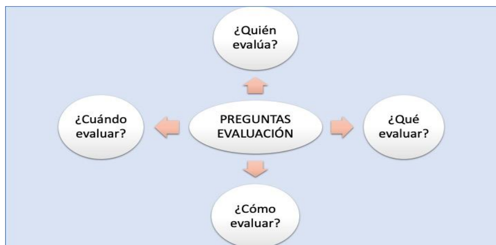
Ilustración 1 Momentos de la evaluación

Comitancillo, San Marcos.