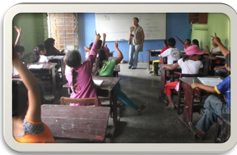
Ilustración 2 Niveles de desempeño

Comitancillo, San Marcos.