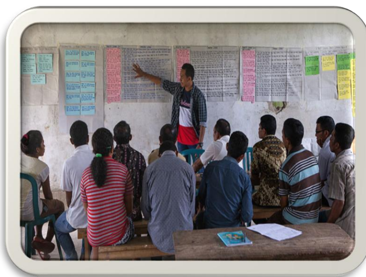
Ilustración 3 Distinguir el trabajo

FUENTE: de investigación propia. Comitancillo, San Marcos.