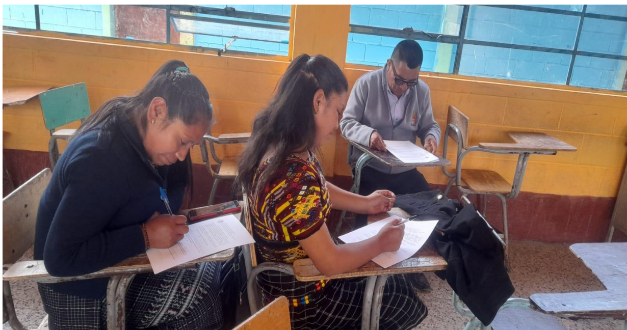
Ilustración 13 Investigación de campo con docentes del Instituto Básico Aldea Tuichilupe