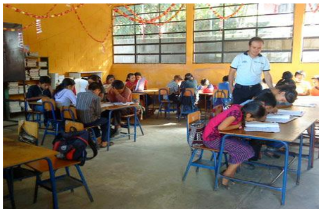
Ilustración 4 Descriptores de niveles previos

FUENTE: de investigación propia. Comitancillo, San Marcos.