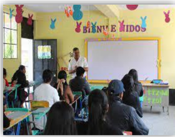
Ilustración 8 Reacción crítica

FUENTE: de investigación propia. Comitancillo, San Marcos.