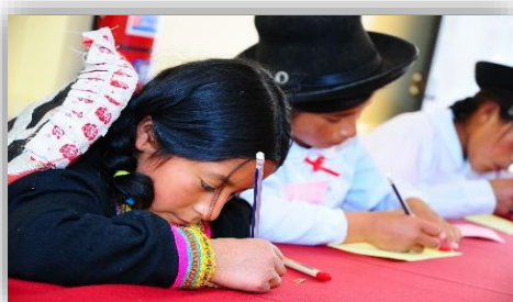
Ilustración 5 entrevista individual