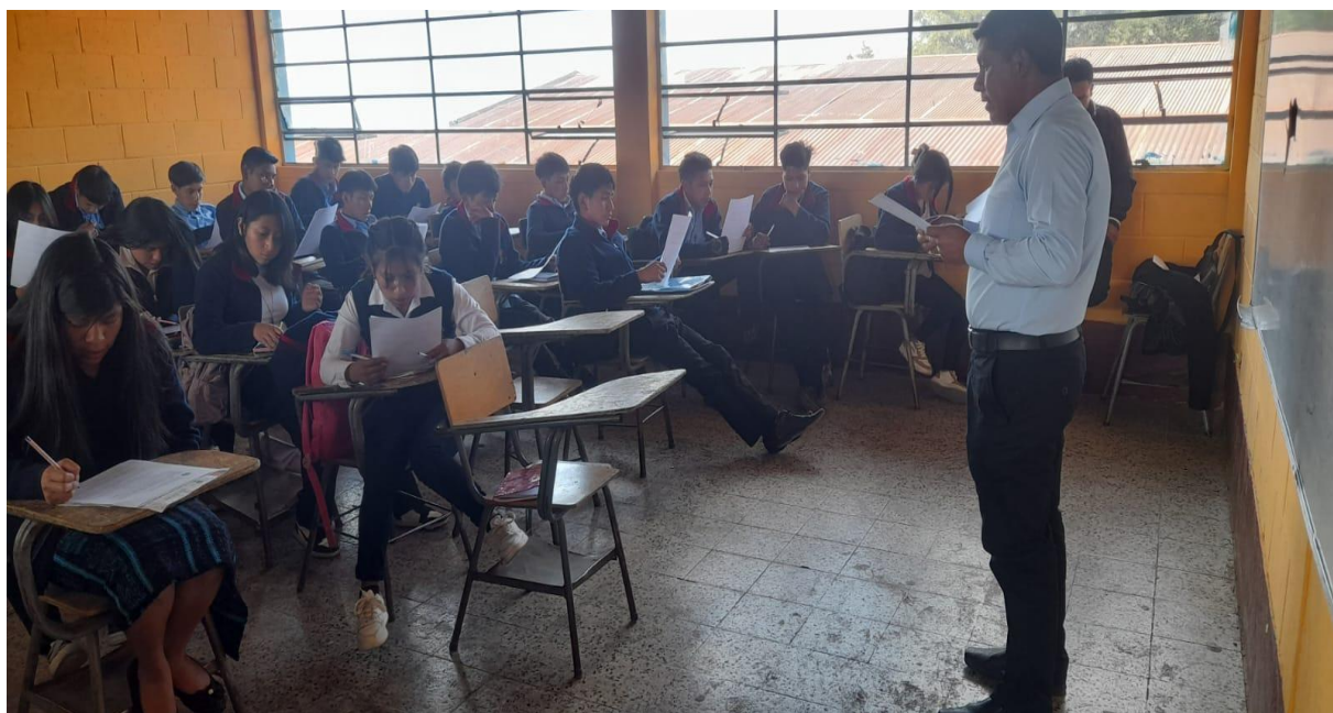
Ilustración 14 Investigación de campo con estudiantes del Instituto Básico Aldea Tuichilupe