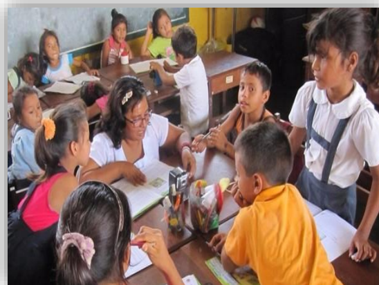
Ilustración 6 Evaluación grupal

FUENTE: de investigación propia. Comitancillo, San Marcos.