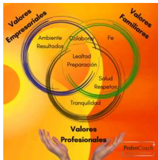
Ilustración 6 Habla de los valores y por qué son importantes para ti