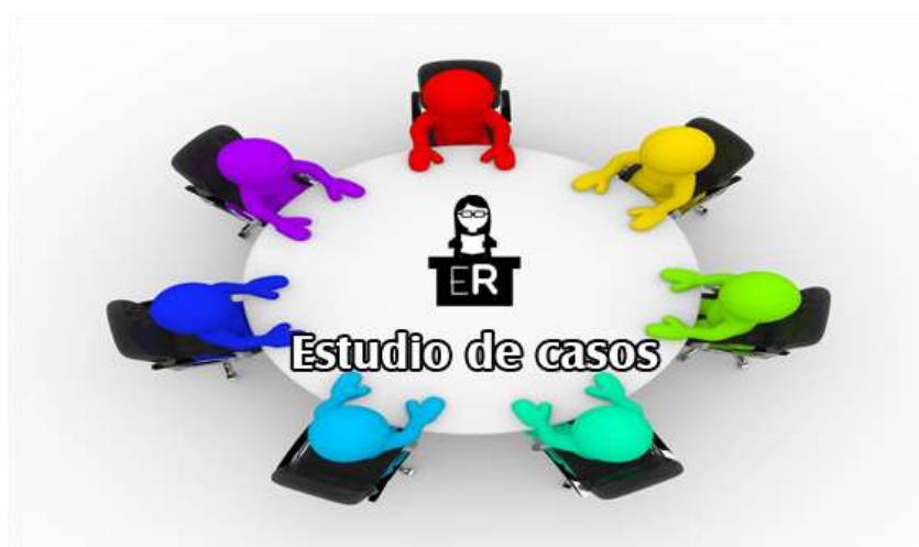
Ilustración 10 Análisis de casos

Puede exponerse la historia de una persona que huye de la guerra, que sufre acoso escolar o que pasa por un trastorno de la conducta alimentaria, entre otras situaciones, para que los menores se metan en la historia y desarrollen la empatía y la tolerancia.