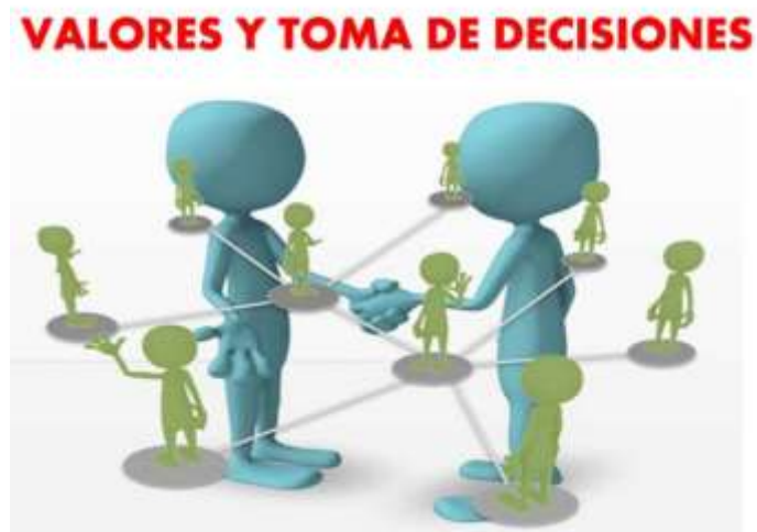
Ilustración 7 Habla de por qué tomas ciertas decisiones en función de tus valores