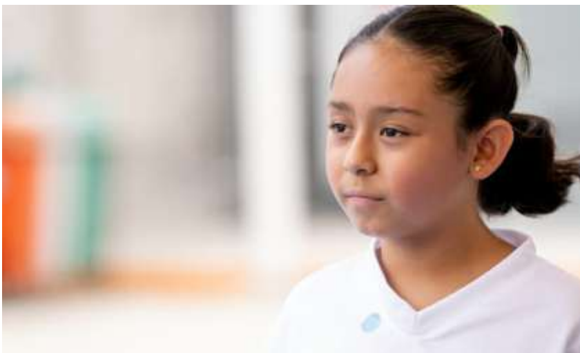
Ilustración 2 Cómo enseñar valores