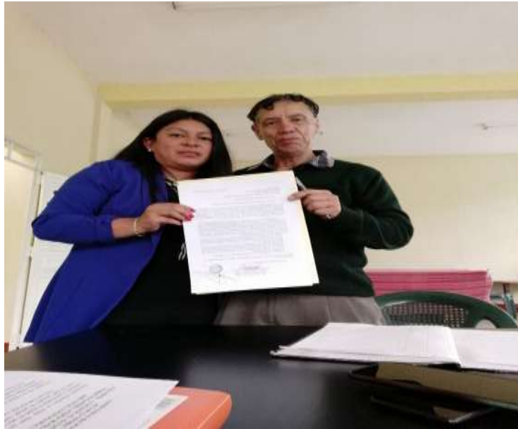
Ilustración 12 Investigación de campo supervisor