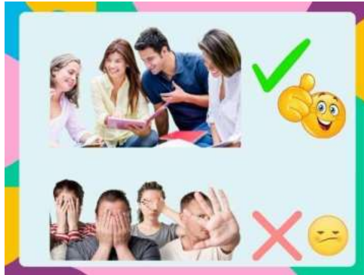
Ilustración 5 No es lo que dices, es lo que haces