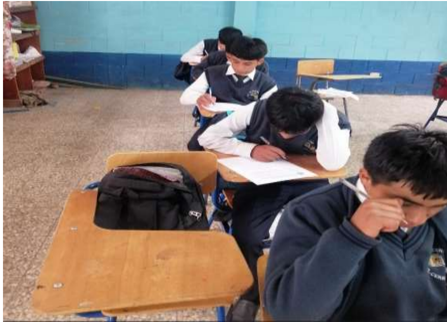
Ilustración 14 Estudiantes encuestados