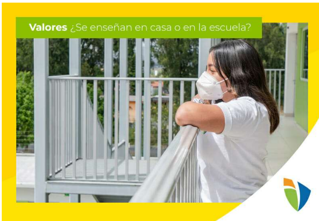
Ilustración 1 Valores en casa y en la escuela