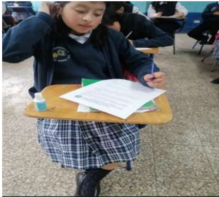
Ilustración 13 Estudiantes encuestados