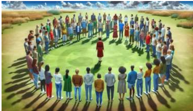
Ilustración 9 Actividades para trabajar valores

a los niños para la vida, equipándolos con las herramientas académicas, confianza y los valores que necesitan para ser ciudadanos responsables y compasivos.